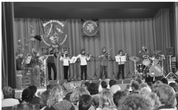
Auftritte vor grossem Publikum verschaffen Nervenkitzel, aber auch Zufriedenheit und Stolz.